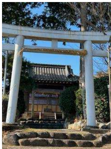
【 水神社 】

さて、話は変わりますが、私は小学生の頃に団体スポーツを習っていました。小さい頃からそのスポーツが好きで、放課後は友達とよくそのスポーツをして遊んでいました。生活の中にそのスポーツが重要な位置を占めていたと思います。中学年になると、周りの友達から「少年団に入らないか」と誘いを受けることが多くなります。私も友達と一緒にプレイしたいと思っていましたが、父母の承諾がなかなか得られませんでした。ようやく入団が認められたのは、小学6年生目前であったと思います。友達と一緒に練習や試合に出ることができると嬉しかったことを覚えています。